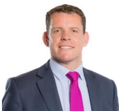
Rhun ap Iorwerth Comisiynydd â chyfrifoldeb dros ieithoedd swyddogol

Heb os, mae'r flwyddyn ddiwethaf wedi bod yn heriol i bawb. Mae'r ffaith ein bod wedi parhau i weithredu trwy symud ein holl waith i blatfformau ar-lein a hynny heb gollir gallu i ddarparu gwasanaethau dwyieithog yn ddiogel yn dyst i'r ffaith ein bod yn sefydliad dwyieithog yng ngwir ystyr y gair. Yn sicr, mae darparu gwasanaethau dwyieithog yn ddiogel ac yn ddieithriad yn rhan annatod o'n meddylfryd fel sefydliad. Serch hynny, mae'n bwysig ein bod yn parhau i arwain trwy esiampl ac i osod rhagoriaeth fel ein nod bob amser.